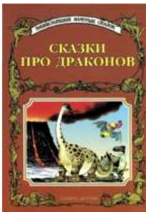
Сказки про драконов. – Москва : Планета детства, 2001. – 56 с.