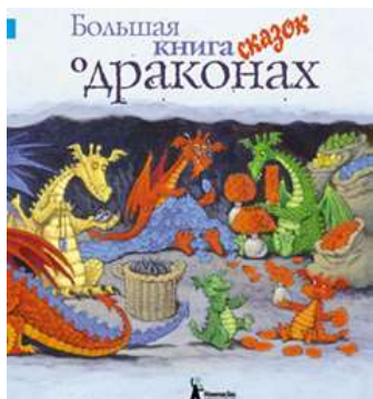
Большая книга сказок о драконах. – Москва : KompasGid, 2011. – 116 с.

Эта книга для настоящих драконолюбов: в сборник вошли волшебные сказки и истории о драконах, интересные факты, стихотворения, загадки, игры, мастерилки. Драконы представлены во всем многообразии: тут и всем известный Змей Горыныч, и одинокий беззащитный дракон Вилли, и маленький, но смелый дракончик Сульфо, и чудовище Вильям, обитающее на дне Шотландского озера, и многие другие. Иллюстрации к сказкам яркие и красочные, интересно, что выполнены они разными художниками.