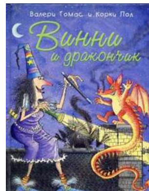
Валери Т. Винни и дракончик / Томас Валери. – Москва : Розовый жираф, 2008. – 25 с.

– Мы знали, что рано или поздно так случится. Существовало старое пророчество о девочке и юном дракончике, которые победят Злыдней».