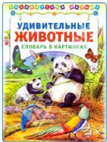
Удивительные животные: словарь в картинках. – М. : АСТ-Пресс, 2012.

На земле живет много разных диких животных. И все они наши меньшие братья. У каждого свой характер, свои повадки, свой дом. Эта книга познакомит вас с ними поближе, и вы полюбите их так же, как любите своих домашних питомцев. Для чтения родителями детям.