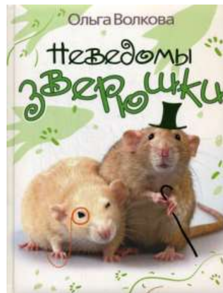
Волкова О. Неведомы зверюшки. - М. : ОлмаМедиаГрупп, 2010.

С помощью этой книги вы сможете ребенку увидеть в окружающем мире то, что он порой не замечает, на что даже не всякий взрослый обратит его внимание. Так многие дети в 4 года уже знают основные цвета, но не всегда могут различить их по насыщенности. Поэтому книга акцентирует внимание на том, что есть более светлые и менее темные цвета. Основной принцип этого игрового пособия: постоянное обращение к хорошо знакомым объектам и понятиям. Второй принцип: самостоятельное рассуждение и точное выполнение игровых заданий. Третий принцип: психологическая установка на то, что у малыша все получится. Пособие рассчитано на длительное "общение" и на повторное возвращение к нему.