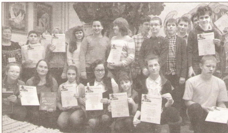
Конференция завершилась. Все довольны

новых читателей, позволила посмотреть на мир другими глазами. Главный вывод, который мы сделали для себя как организаторы: современные подростки готовы к чтению серьёзных публицистических книг, могут и хотят обмениваться мнениями, спорить, рассуждать. Книга Януша Корчака будет помогать им идти по жизни уверенно и правильно.