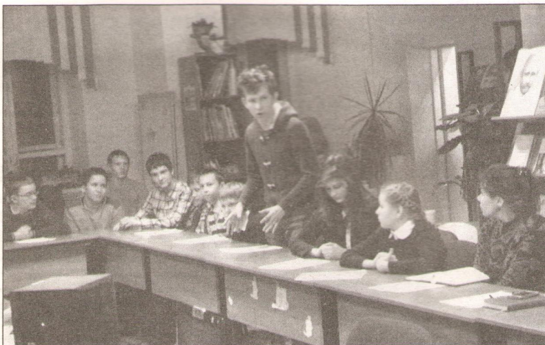
Обсуждение книги проходило очень живо