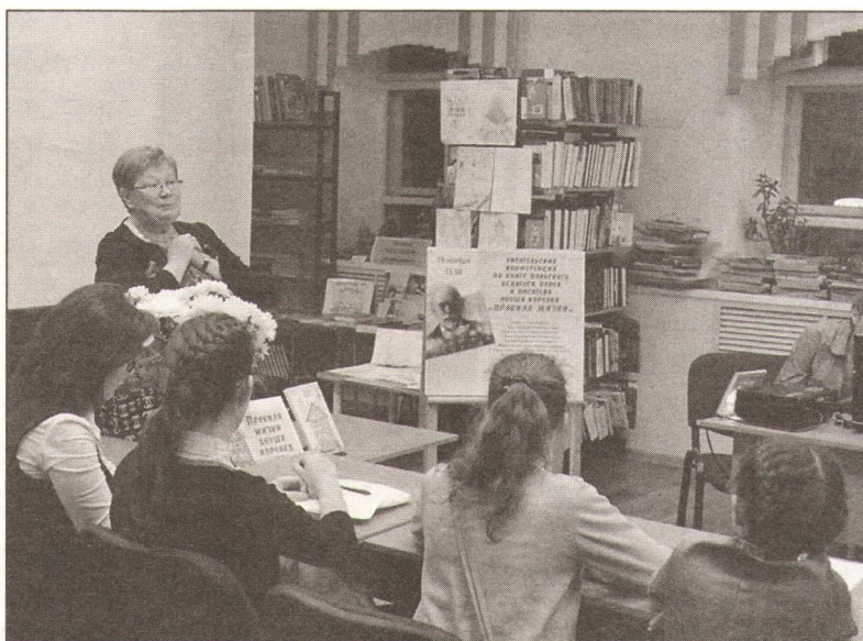
Готовятся читатели, готовится ведущая...

На практике вступительная часть растянулась на 20 минут, само обсуждение — на 45 минут, и лишь торжественная часть прошла динамично. Участвовали 45 человек. Среди них были учащиеся школ № 9, № 27, гимназии имени А.С. Пушкина г. Сыктывкара, школьники Сыктывдинского района, студенты библиотечного отделения Коми республиканского колледжа культуры имени В.Т. Чисталева, их родители, педагоги, библиотекари Сыктывкарской ЦБС и Национальной детской библиотеки Республики Коми имени С.Я. Маршака.